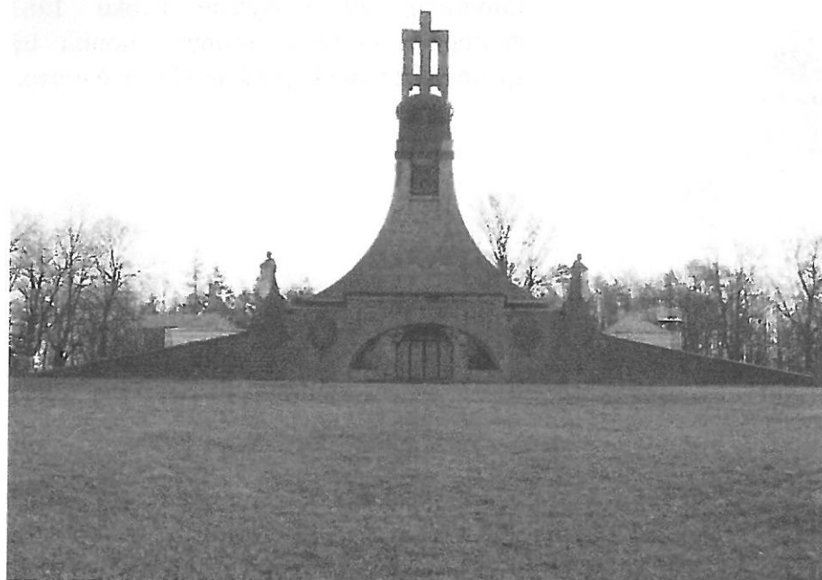
Návrh vyhlídkových plošin, stávající stav – zakres do fotografie

Ad. 3.: Navrhované vyhlídkové plošiny nejsou navrženy vůči objektu muzea symetricky, z tohoto důvodu uvádíme podmínku prověření jiných tvarů vyhlídkových teras, např. teras na půdoryse kruhu, které by mohly v důsledně osově symetrickém areálu působit pohledově příznivěji. Z důvodů pohledové kolize zejména z dálkových pohledů nelze doporučit případné nasvětlení vyhlídkových plošin.