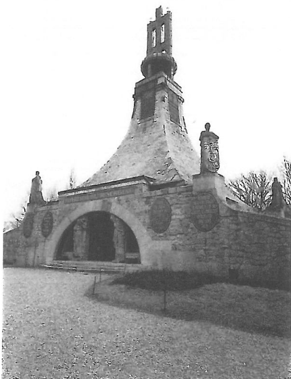
Fotografie z roku 1981

Ad. 2.: Povrchová úprava před vstupem do Mohyly míru bude shodná se stávajícím provedením, což dokládají i dobové fotografie, viz fotografie z roku 1981. Přístupové cesty k Mohyle mohou být zpevněny z důvodu jejich opakované eroze.