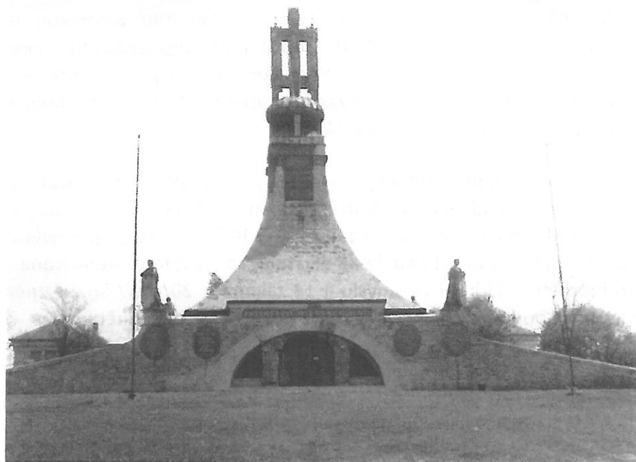
Pohled na mohylu míru a objekt muzea z roku 1954